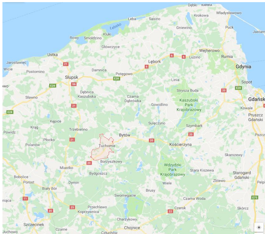
Mapa z położeniem gminy Tuchomie