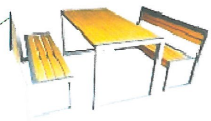
4. nowe ławki,