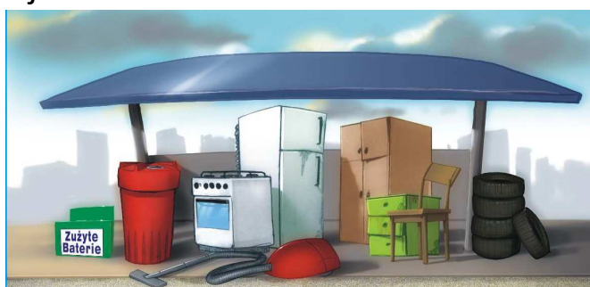
PSZOK zlokalizowany będzie przy oczyszczalni ścieków w Tuchomiu