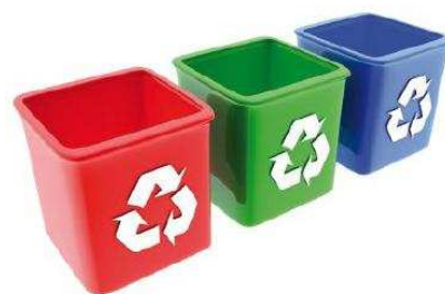
Tabela stawek opłat za gospodarowanie odpadami – dla właścicieli nieruchomości, na których zamieszkują mieszkańcy (bez działalności gospodarczej)

osób faktycznie zamieszkujących nieruchomość. Opłata będzie niższa o 40% , jeśli odpady będą zbierane w sposób selektywny.