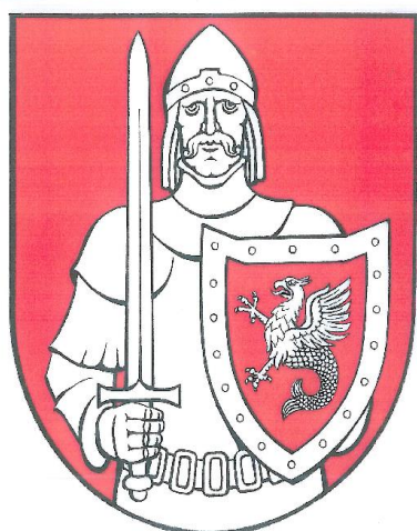
HERB GMINY TUCHOMIE

Po przanalizowaniu i ustosunkowaniu się do zaproponowanych zmian, na sesji Rady Gminy Tuchomie w dniu 30.12.2009r., dokonano wyboru herbu w wersji: W polu czerwonym półpostać rycerza srebrnego z mieczem srebrnym w prawej ręce i tarczą w lewej ręce. Na tarczy z okuciem srebrnym w polu czerwonym gryforyb srebrny.